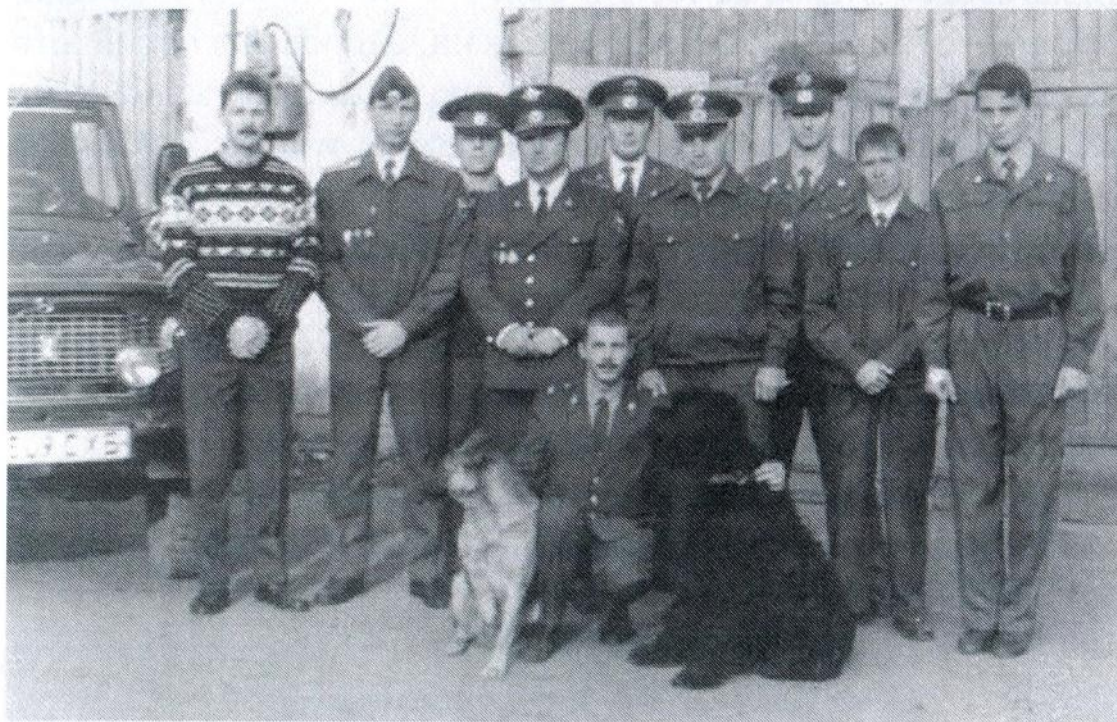
Александровск-Сахалинский ОУР конец 90-х годов

На службе в уголовном розыске я перестал обращать внимание на т.н. внешние признаки сотрудников. Бывало, признанный пролётчик и внешне разгильдяй водитель дежурной части, на которого ты и не надеешься во время ночного выезда