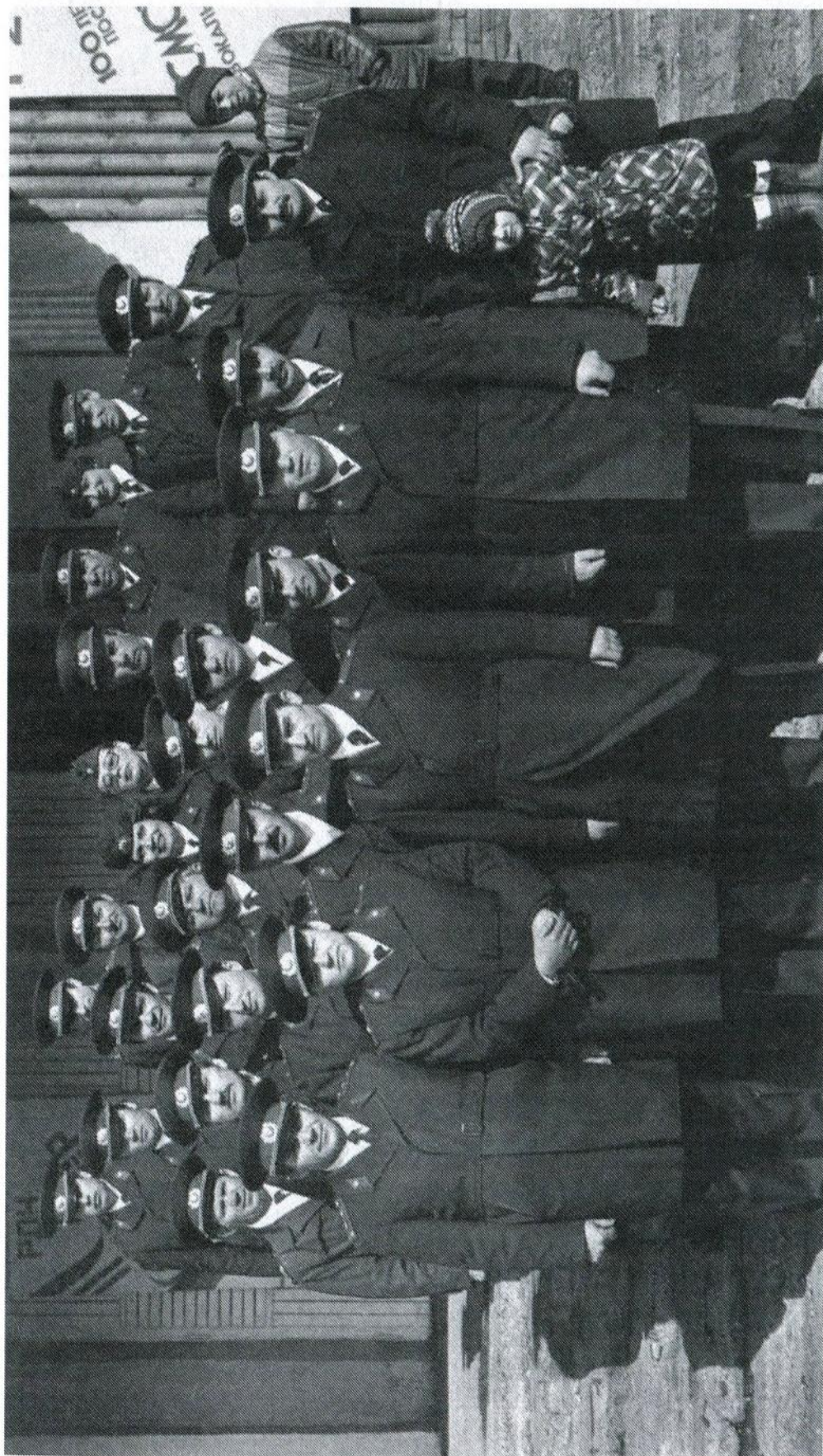
1986 год. Первомайский праздник. Офицерский состав Александровск-Сахалинского отдела внутренних дел