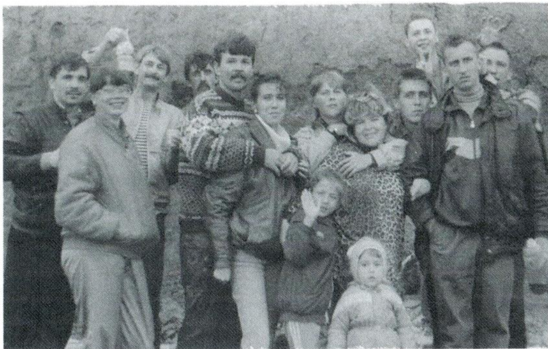
Опера в редкие часы отдыха с семьями

остались полости величиной до метра, используемые как подпол. Так мне был преподан урок оперативного сопровождения. А ещё я получил первую премию за раскрытое преступление – 20 рублей.