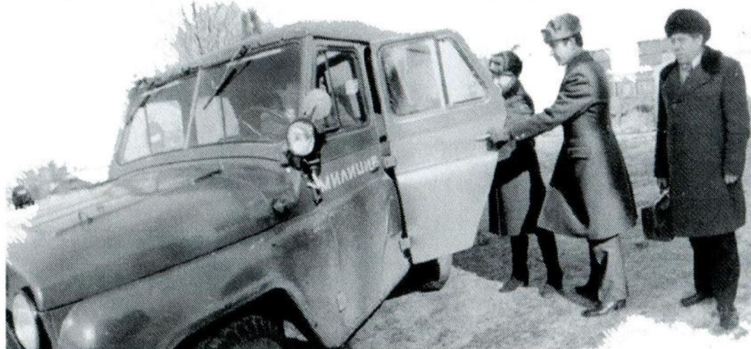
1985 год. «Опергруппа на выезд!»