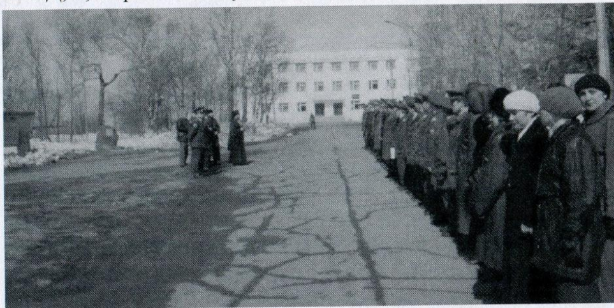
16 апреля 1998 года. Первый официальный День Сахалинской милиции

Когда в 1998 году я, исполняющий обязанности начальника ГОВД, и, выросший из уголовного розыска, начальник СМОБ